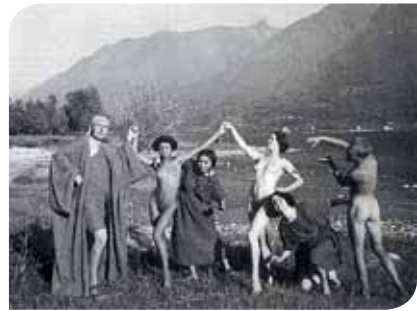
Tänzerinnen und Tänzer am Seeufer

19. Jahrhunderts ein Gräuel. Sie stammen meist aus begüterten Familien und wollen ihr vorbestimmtes Leben hinter sich lassen. Auf dem Monte Verità finden sie ihr Paradies: In wallenden Gewändern oder ganz nackt leben, lieben und tanzen sie in unberührter Natur, ernähren sich vegetarisch und probieren eine alternative Form des Zusammenlebens. Die allerersten Hippies ziehen viele Maler, Schriftsteller, Musiker und andere Bohémiens an und beeinflussen deren künstlerisches Schaffen nachhaltig. Mit unserer Veranstaltungsreihe möchten wir in Vorträgen, Seminaren und Workshops an die nach wie vor modernen Ideen der frühen Lebensreform erinnern und sie in die heutige Zeit übersetzen.