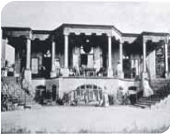
Das Sanatorium auf dem Monte Verità

...auf dem „Berg der Wahrheit“. Monte Verità – so taufte im Jahr 1900 eine Gruppe von jungen Aussteigern einen Hügel über dem Städtchen Ascona in der südlichen Schweiz. Den Pionieren des alternativen Lebens ist die Konsumwelt des ausgehenden